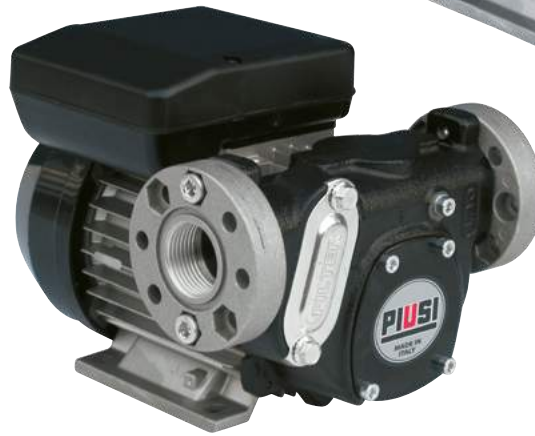
PANTHER 72 - PANTHER 90 (con embridado)