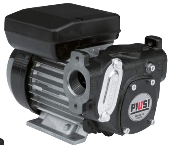
PANTHER 56 (sin embridado)