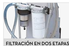
FILTRACIÓN EN DOS ETAPAS