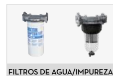
FILTROS DE AGUA/IMPUREZAS