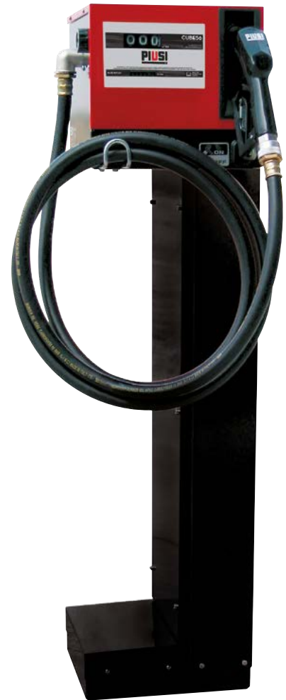
CUBE 56 CON PEDESTAL (OPTIONAL)