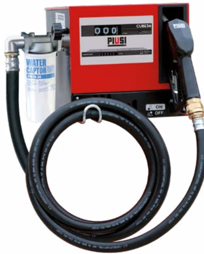
CUBE 56 CON FILTRO