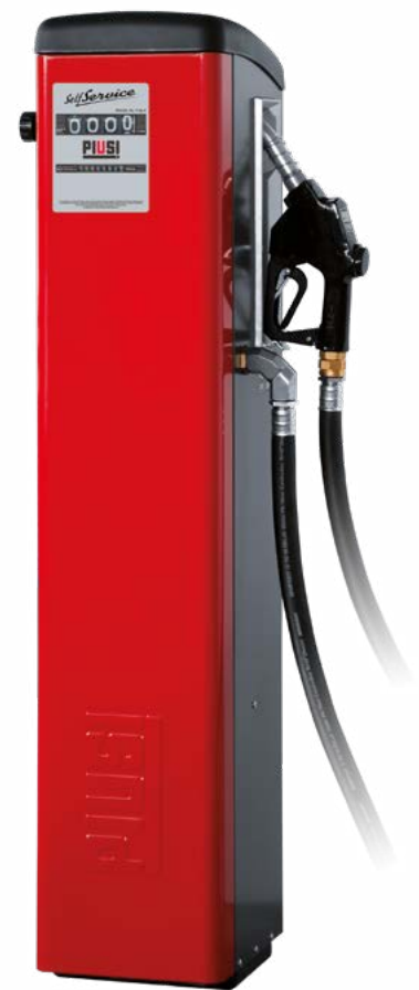
SELF SERVICE K44