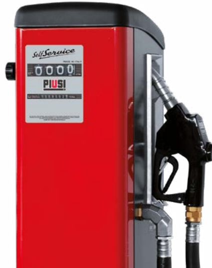
MEDIDOR MECÁNICO INTEGRADO