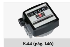
K44 (pág. 146)