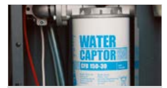
FILTRO INTEGRADO (pág.170)