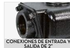
CONEXIONES DE ENTRADA Y SALIDA DE 2"