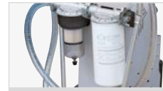
FILTRACIÓN EN DOS PASOS