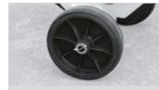
RUEDAS DE GRAN DIÁMETRO